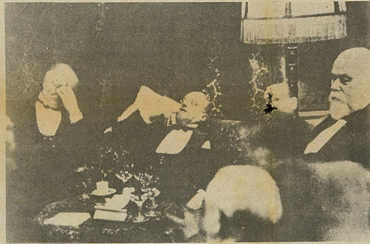
El doctor Erich Salomón (izquierda) fue el introductor de la fotografía espontánea. Su imagen de la derecha muestra a un grupo de políticos en la conferencia de La Haya, después de una reunión.

las cámaras de prensa usadas hasta la fecha y tenía un tamaño discreto para ocultarla en caso de necesidad.